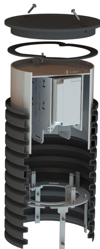
Uložení boxu v MUC 315

Pro další varianty kontaktujte naše obchodní oddělení